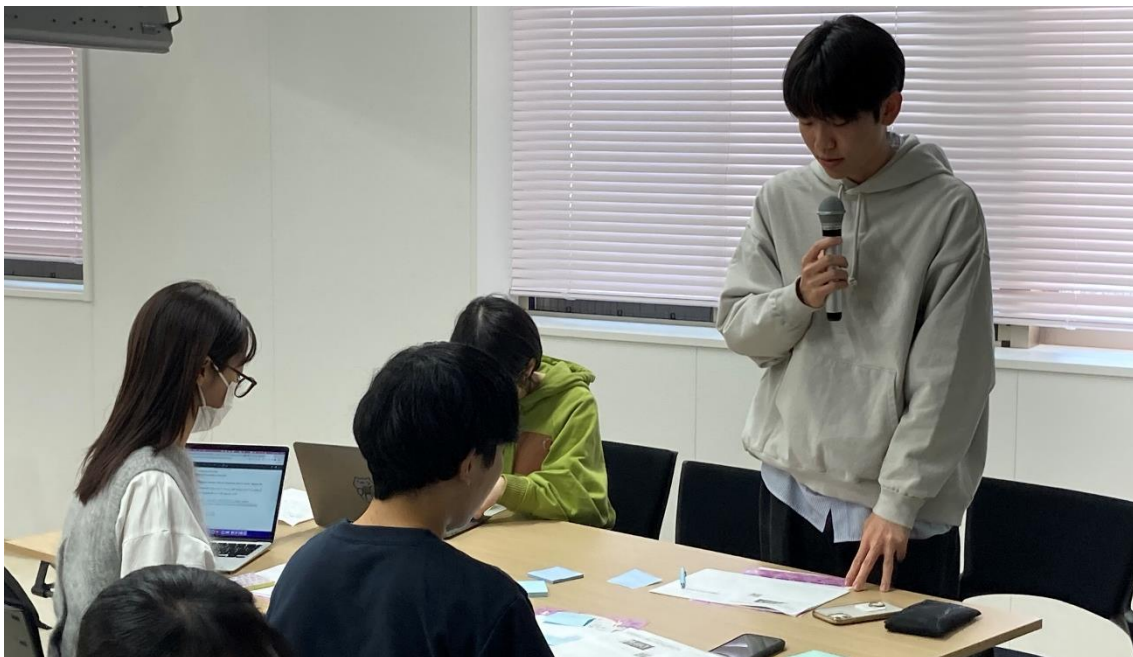
写真③：グループワークの内容を報告する参加者