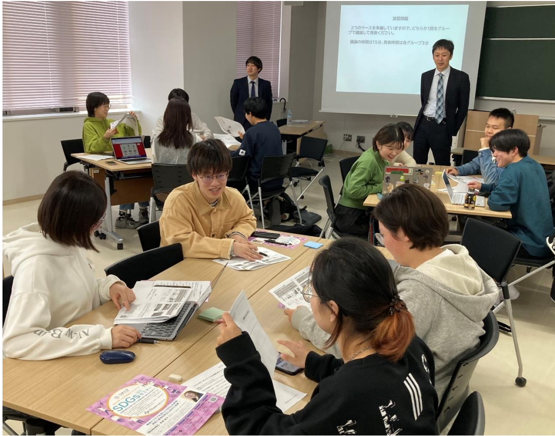
写真②：楽しそうにグループワークに取り組む参加者